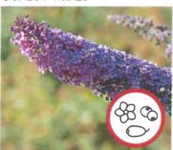
Sommerflieder Buddleja davidii Blüten und Samen