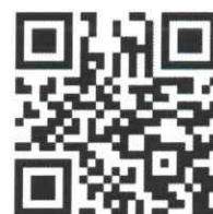
Weitere Pflanzen und Informationen

Der KEZO-Sammeldienst wird auf der regulären Kehrrichttour auch die Neophytensäcke am gewohnten Sammelpunkt einsammeln. Grössere Mengen an Ast- und Wurzelmaterial können direkt bei den Kehrrichtverbrennungsanlagen oder Grüngutvergärungsanlagen in Ihrer Region entsorgt werden.