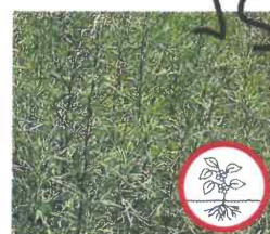
Verlotscher Beifuss Artemisia verlotiorum Ganze Pflanze