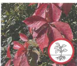
Jungfernrebe Parthenocissus agg., P. inserta / P. quinquefolia Ganze Pflanze