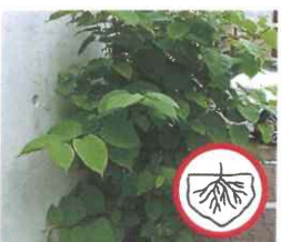
Staudenknöteriche Reynoutria spp. Alles Pflanzenmaterial aus dem Boden