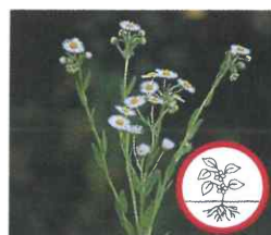
Einjähriges Berufkraut Erigeron annuus Ganze Pflanze