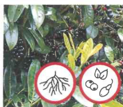
Kirschlorbeer Prunus laurocerasus Früchte und Wurzeln