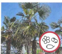
Hanfpalme Trachycarpus fortunei Blüten und Früchte