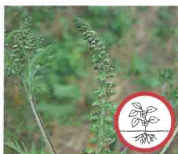
Ambrosia Ambrosia artemisiifolia Ganze Pflanze

Alle fortpflanzungsfähigen Pflanzenteile von exotischen Problempflanzen werden im Neophytensack entsorgt.