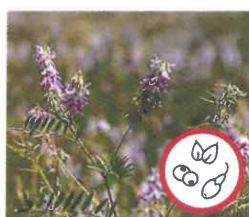
Geissraute Galega officinalis Hülsenfrüchte