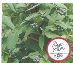
Asiatische Geissblätter Lonicera henryi , L. japonica Ganze Pflanze