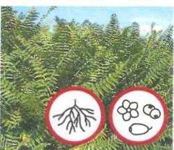
Götterbaum Ailanthus altissima Wurzeln, Blüten und Samen