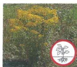
Amerik. Goldruten Solidago canadensis , S. gigantea Ganze Pflanze