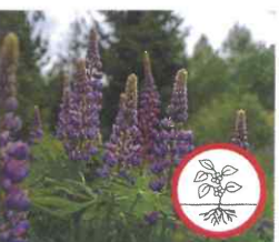
Vielblättrige Lupine Lupinus polyphyllus Ganze Pflanze