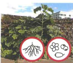
Blauglockenbaum Paulownia tomentosa Wurzeln, Blüten und Samen