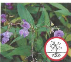
Drüsiges Springkraut Impatiens glandulifera Ganze Pflanze