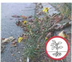
Schmalbl. Greiskraut Senecio inaequidens Ganze Pflanze